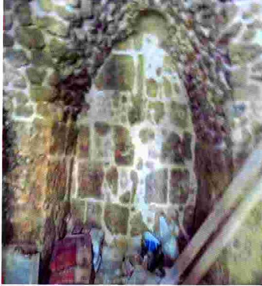
منزل محيي الدين عابدين خلال عمليات الترميم

برنامج الامم المتحدة الانمائي / برنامج مساعدة الشعب الفلسطيني