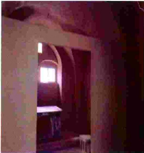
حوش فراح خلال عمليات الترميم