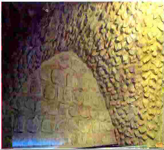
منزل فاطمة ادريس خلال عمليات الترميم