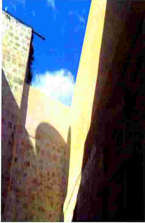
حوش فراح بعد الترميم

برنامج الامم المتحدة الانمائي / برنامج مساعدة الشعب الفلسطيني