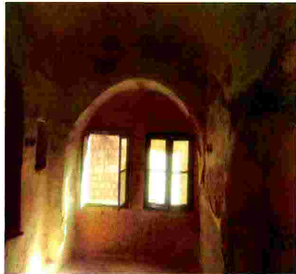
حوش فراح قبل الترميم