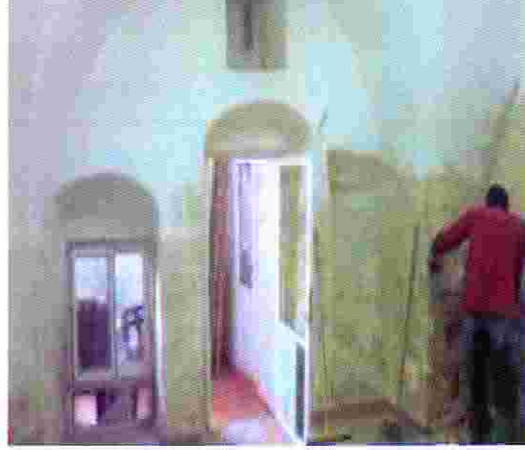
منزل زهير النتشة قبل الترميم