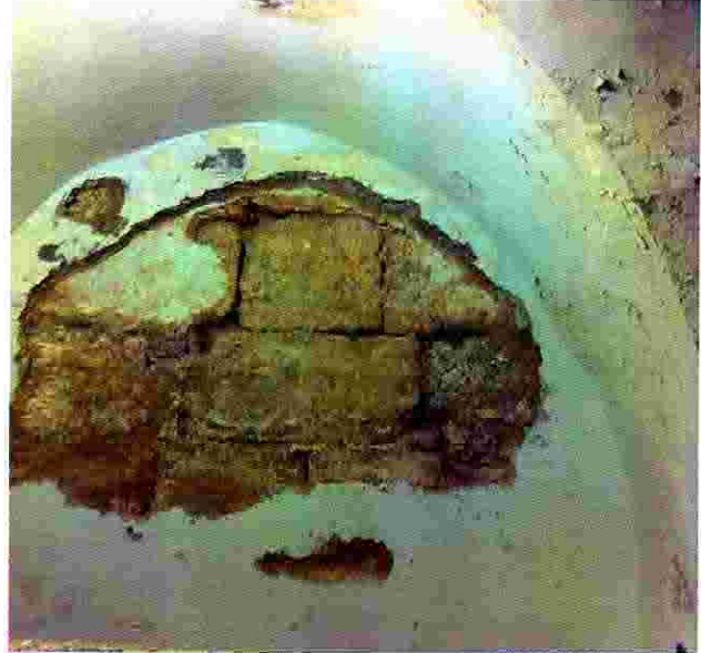
منزل محيي الدين عابدين قبل الترميم