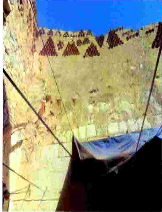
حوش فراح قبل الترميم