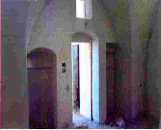
منزل زهير النتشة خلال عمليات الترميم

برنامج الامم المتحدة الانمائي/ برنامج مساعدة الشعب الفلسطيني