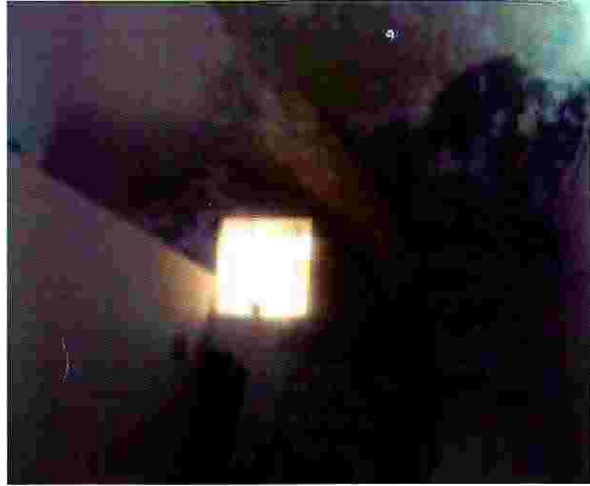
منزل فاطمة ادريس قبل الترميم